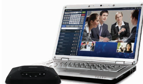
PCs über Bluetooth oder USB