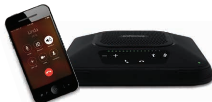
Mobiltelefon über Bluetooth