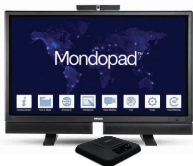
Mondopad über USB

Verwenden Sie Thunder mit dem InFocus Mondopad für glasklare, effiziente Videokonferenzen in kleineren und mittleren Besprechungsräumen. Mit den optionalen Mic Pods eignet sich Thunder auch für größere Räume. Thunder kann auch mit jeder anderen beliebigen PC-basierten Kommunikationssoftware verwendet werden, wie Skype, Lync, Jabber usw., um Audioqualität und Komfort zu verbessern. Dank Konnektivität über Bluetooth ist die Verwendung mit mobilen Geräten einfach.