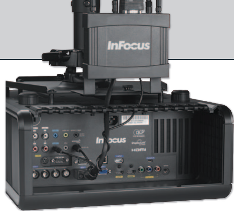
Einfach anschließen, drahtlos präsentieren und einen neuen Netzwerkzugang schaffen