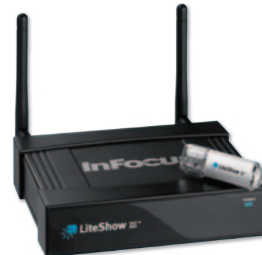
LiteShow III mit USB Stick

LiteShow III hat eine integrierte Videodekodierung, die es ermöglicht Videos (mit Ton) direkt, schnell und problemlos abzuspielen, sogar in hoher Auflösung und von älteren Computern mit weniger Prozessorleistung.